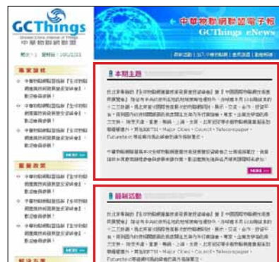
電子報廣告示意圖